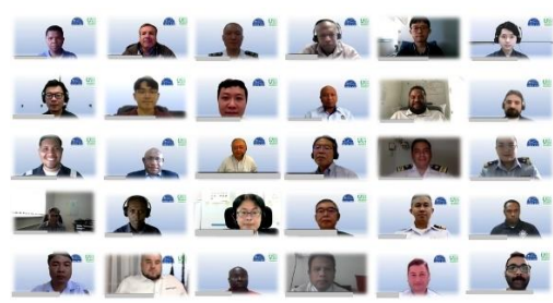
第10回一般研修(座学研修)